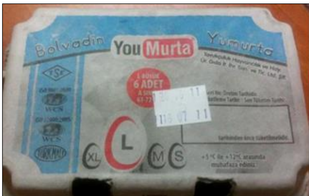
Abb. 8.1 Eierkarton ( https://9gag.com/gag/159060/you-murta-yumurta-means-egg-in-turkish , letzter Aufruf 21.2.2018.)